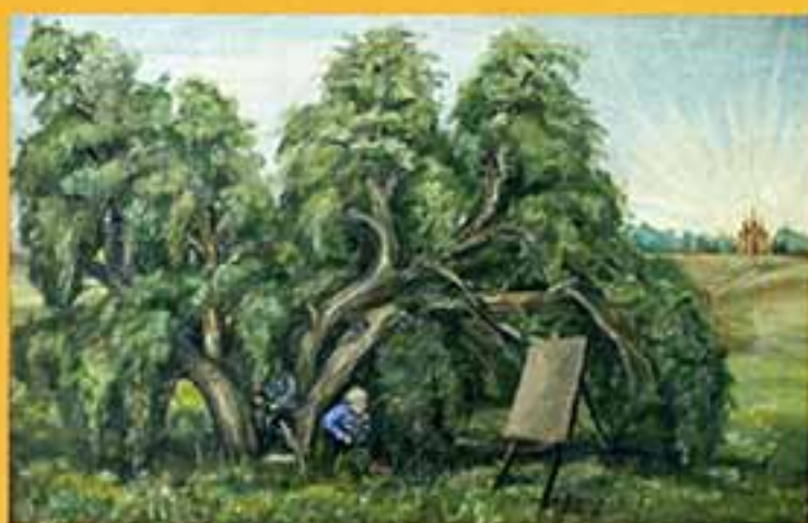
В добрый путь, 2003 г., 44,2х66,2, холст, масло.