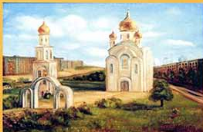
Свято-Воскресенская православная церковь (сон 1993 г.), 2001 г., 40,5x60, холст, масло.