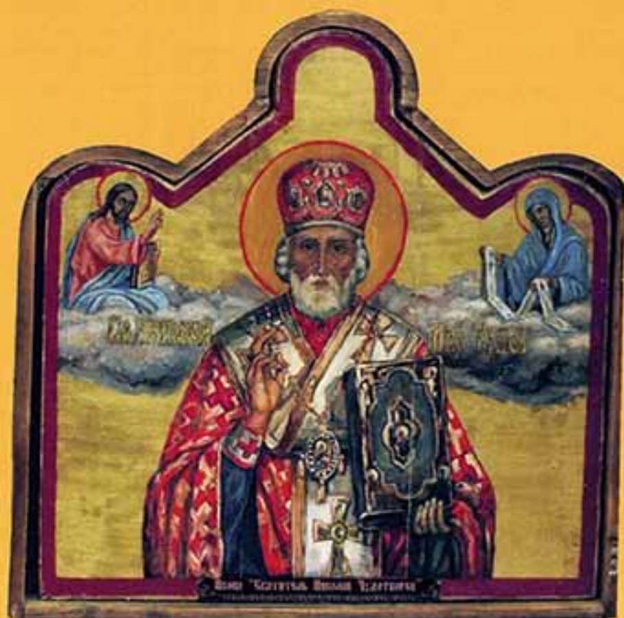
Икона «Святитель Николай Чудотворец», 2002 г., 50x50, доска, масло.