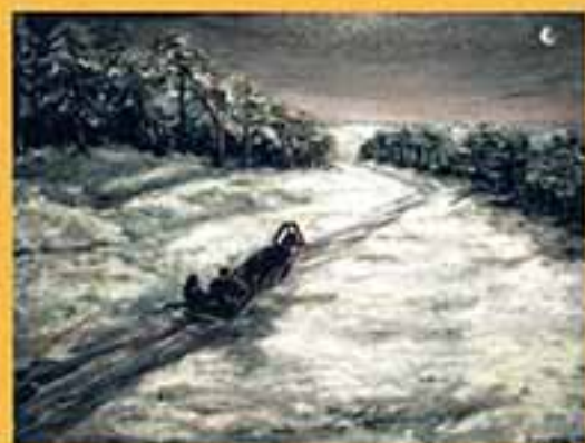
Зима, 1998 г., 47x62, холст, масло.