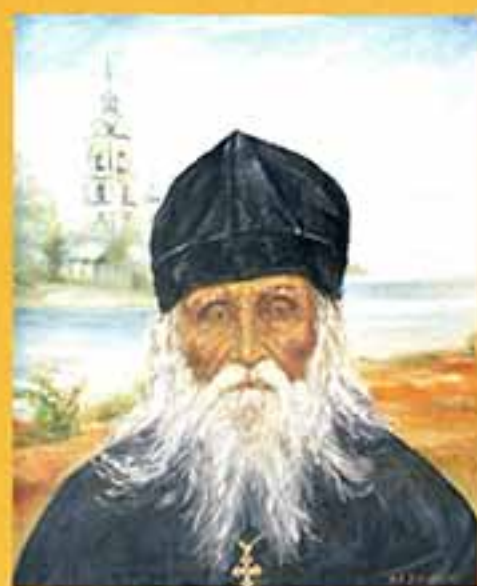
Вон о старце Николае, 2003 г., 60x50,5, холст, масло.