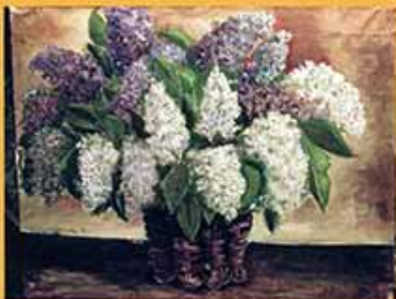
Опрень, 2001 г., 51x35,5, холст, масло.