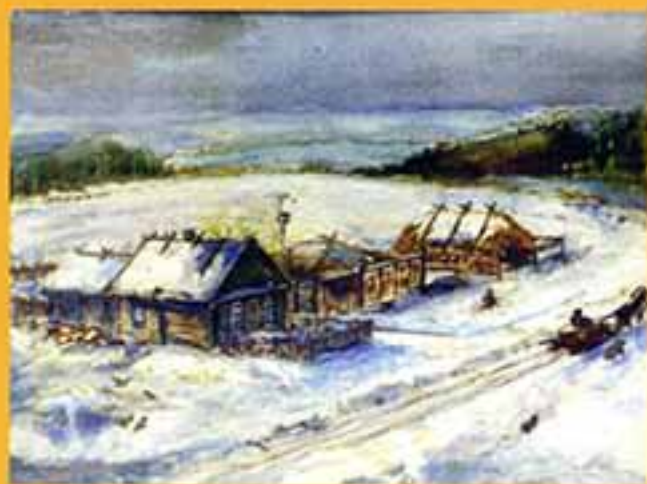
Отчий дом, 1997 г., 15,5х21, бумага, акварель.