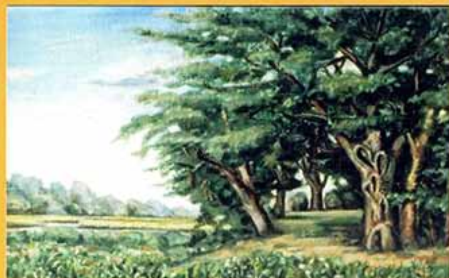
Роща, 2002 г., 52x82, холст, масло.