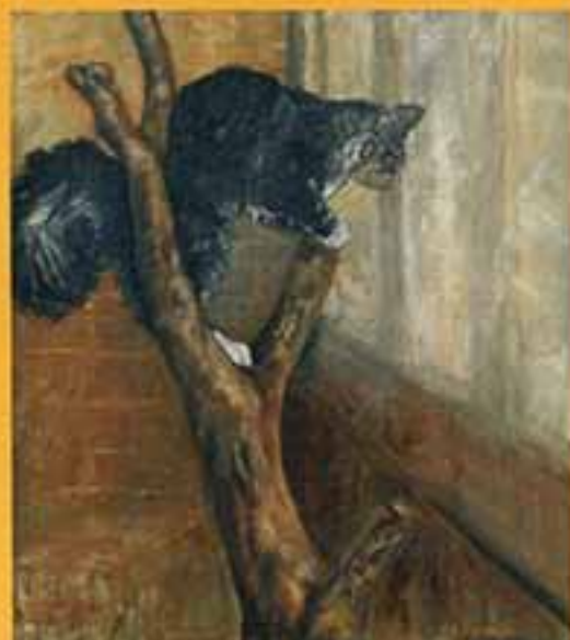
Высоко сидя далеко гляжу (Мурка на лоджии), 2003 г., 60х54, холст, масло.