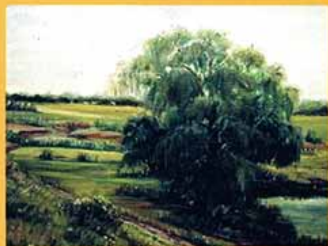
Рыбалка на р. Теренце, 1999 г., 41x51,5, холст, масло.