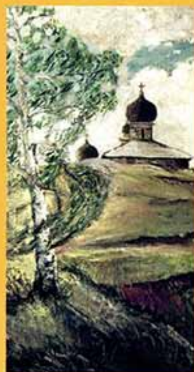
Путь к храму, 1998 г., 50,5x27,7, холст, масло.