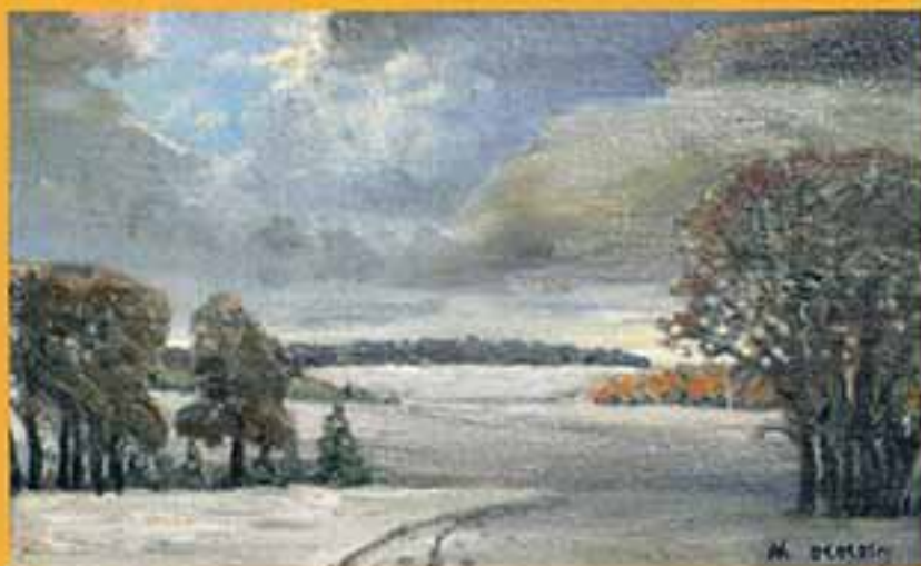
Пожарь, 2001 г., 42,5х67,5, холст, масло.