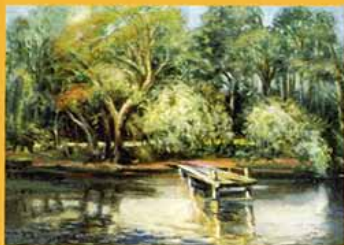
Мостик, 2001 г., 45х60, холст, масло.