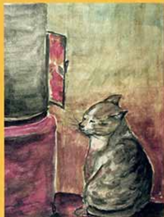
Всем простуженный кот, 1998 г., 29x21, бумага, акварель.