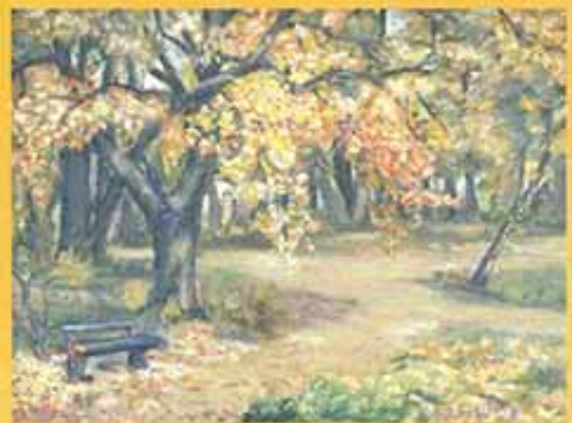
Осень, 2001 г., 30x40, холст, масло.