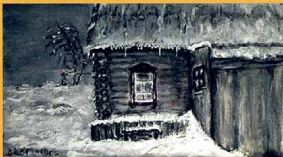
Зимний вечер, 1997 г., 13,5x24,5, бумага, акварель.