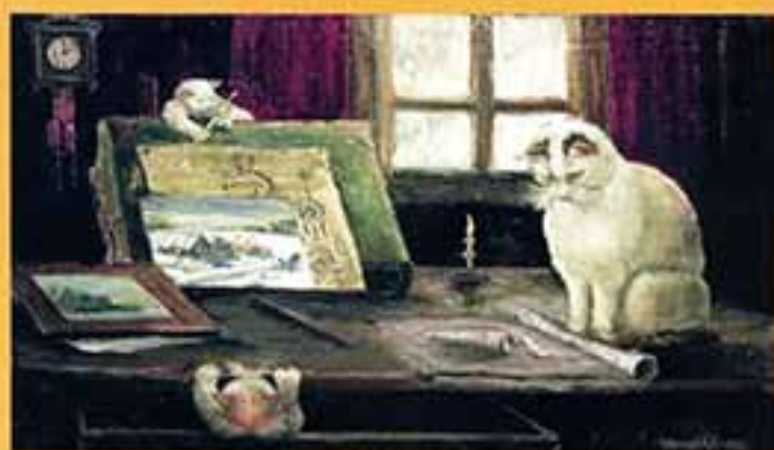
Патронтаст с котятками, 1999 г., 29,7x49,8, холст, масло.