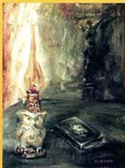
Лавна, 2002 г., 40x30, холст, масло.