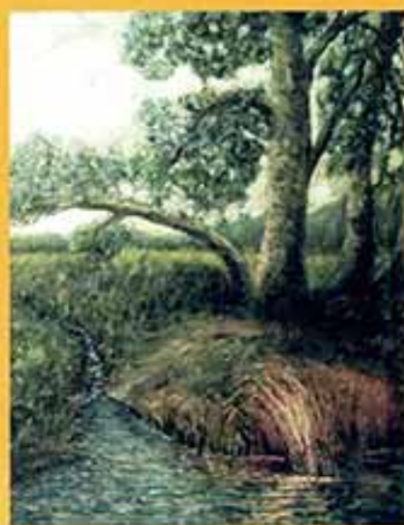
Река Терешка, 2001 г., 34x20,5, холст, масло.