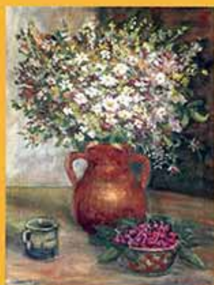
Цветы полевые, 2001 г., 53,5x40,5, холст, масло.