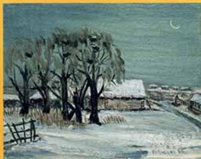
Бело Адовицна, 1998 г., 16,5x21, картон, масло.