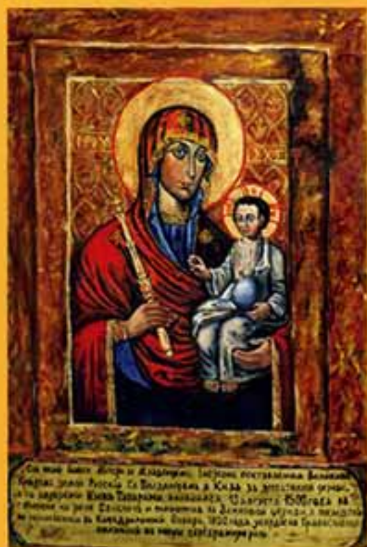
Икона Божией Матери «Минская», 2001 г., 54х36, доска, масло.