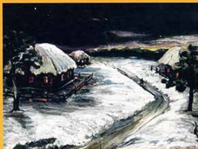
Односторонний страшик, 1998 г., 30,2х40,2, картон, масло.