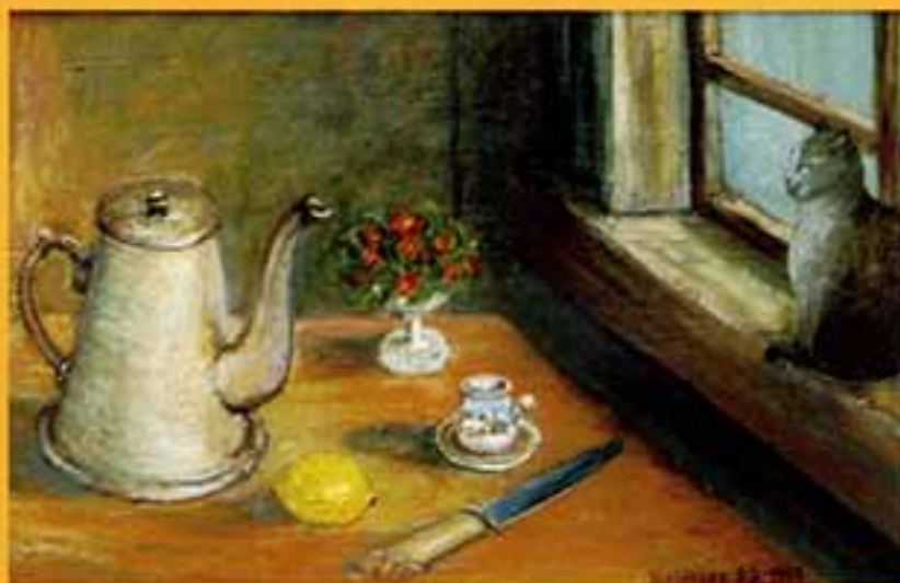
Нагюрморт с кофеином, 1999 г., 26x39,5, холст, масло.