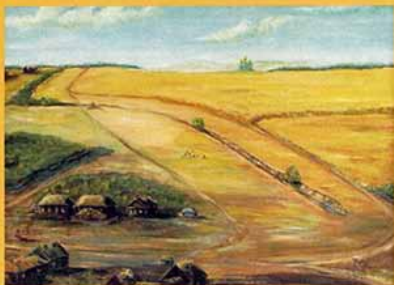
За оградцей, 1998 г., 40x55,5, холст, масло.