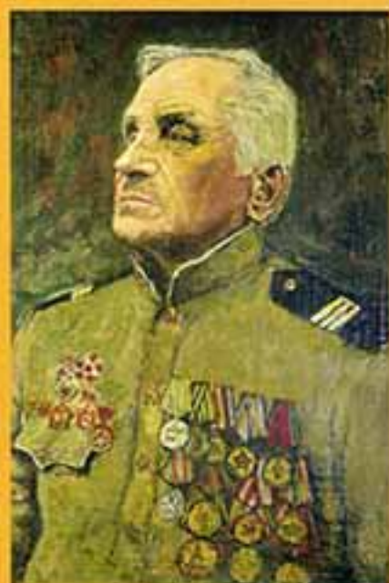
Портрет отца, 1998 г., 31,5х22,5, холст, темпера.