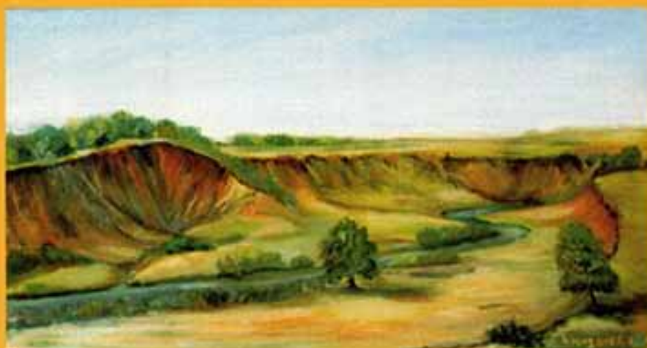
Река Лепейка, 2000 г., 43x78, холст, масло.