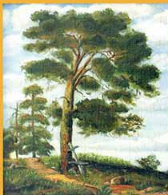
Будька, 1999 г., 29,2х20,5, холст, масло.