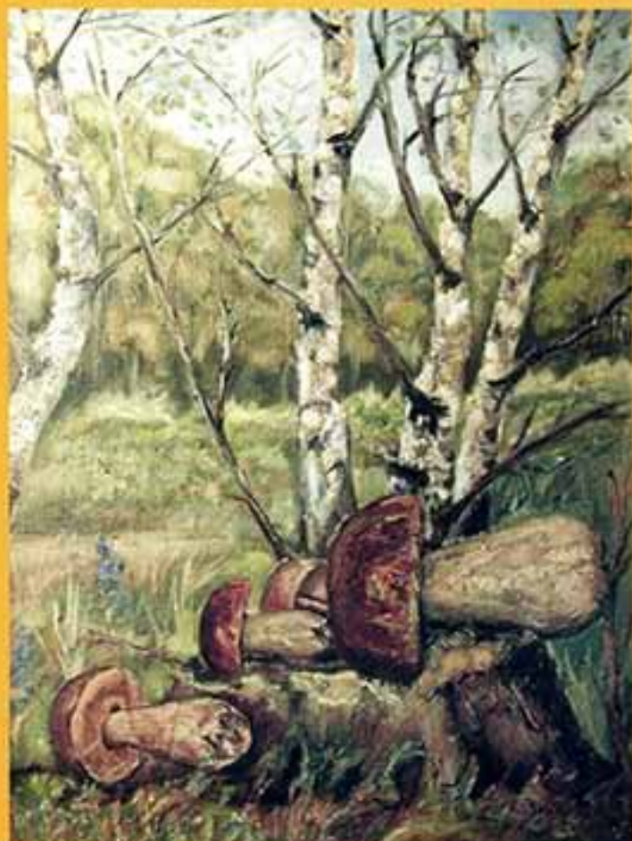
Нагорный лес с грибами, 2001 г., 54x39, холст, масло.