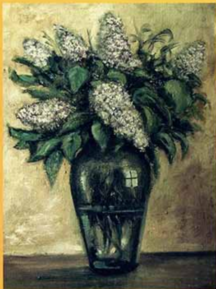
Стрельба, 2001 г., 51x35,5, холст, масло.