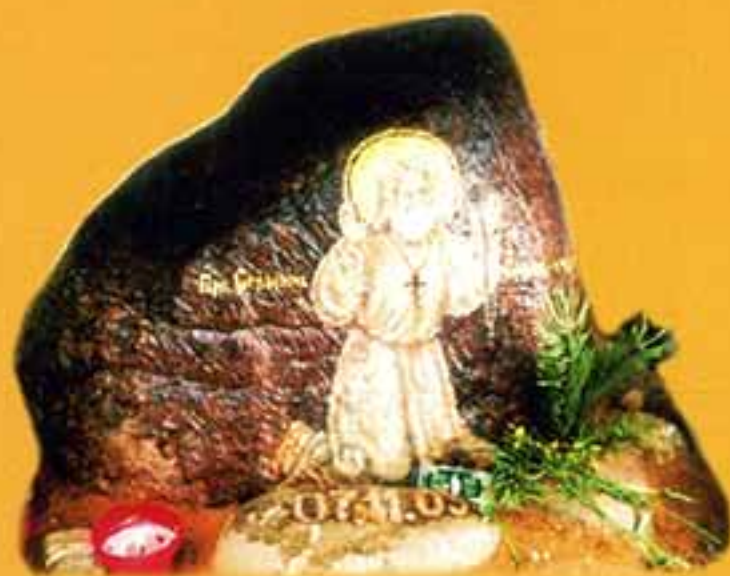
Икона «Прп. Сарфим Саровский, - чудотворец», 2003 г., 40х50х30, камень, масло.