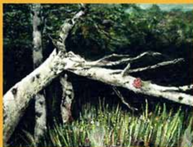
Лес родной, 1998 г., 23,5х30,5, холст, масло.