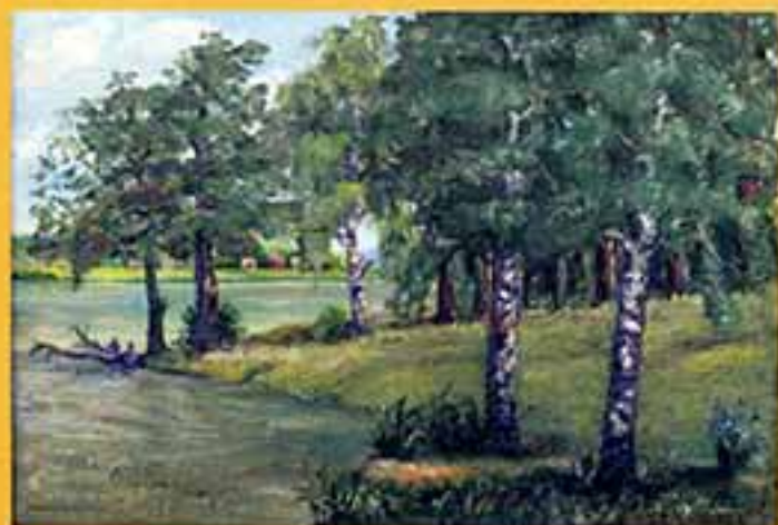
На рывале, 2000 г., 37,5x54, холст, масло.