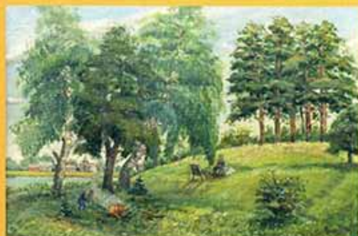
На отдыхе, 2000 г., 38x54, холст, масло.