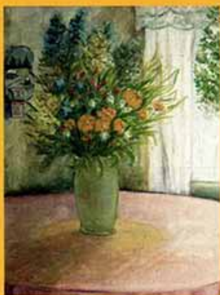
Полевые цветы, 1999 г., 30,5x38,5, холст, темпера.