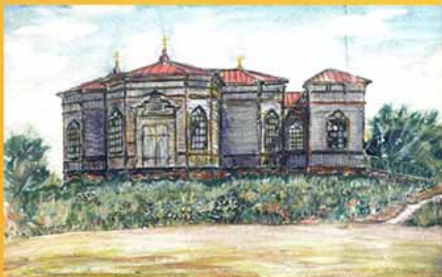
Церковь Знаменье Пресвятой Богородицы с. Адовкищина, 1997 г., 19х29,5, бумага, акв.