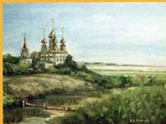
На Мурамщині, 2002 г., 29х38, холст, масло.