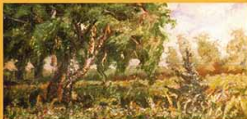
На берегу р. Цна, 2000 г., 15х29, холст, масло.