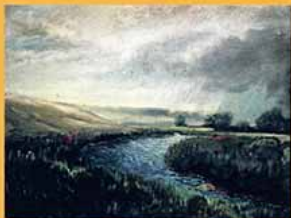
Татарский ключ у с. Кирюшино, 1998 г., 38,5x50, холст, масло.