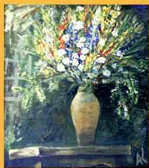
Цветы, 1998 г., 56x52, холст, темпера.