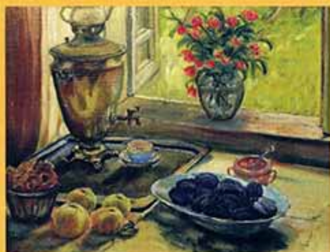
Пасторал со сливами, 1999 г., 40,5x51,5, холст, масло.