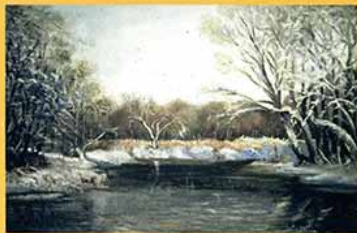
Лощица, 2001 г., 40x60, холст, масло.