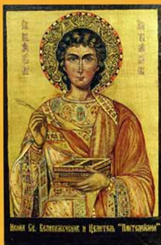
Икона «Св. Василия Великого и Целителя Пантелеимона», 2002 г., 46х30,5, доска, темпера.