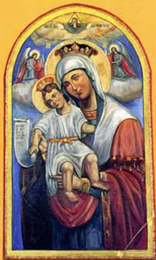
Икона Божией Матери «Достоинно есть», 2001 г., 113x68, холст, масло.