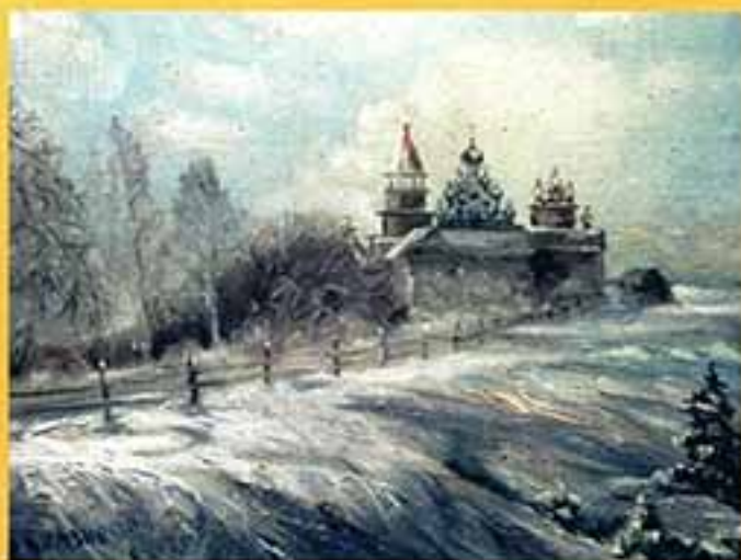
Церковь, 2001 г., 30x40, холст, масло.