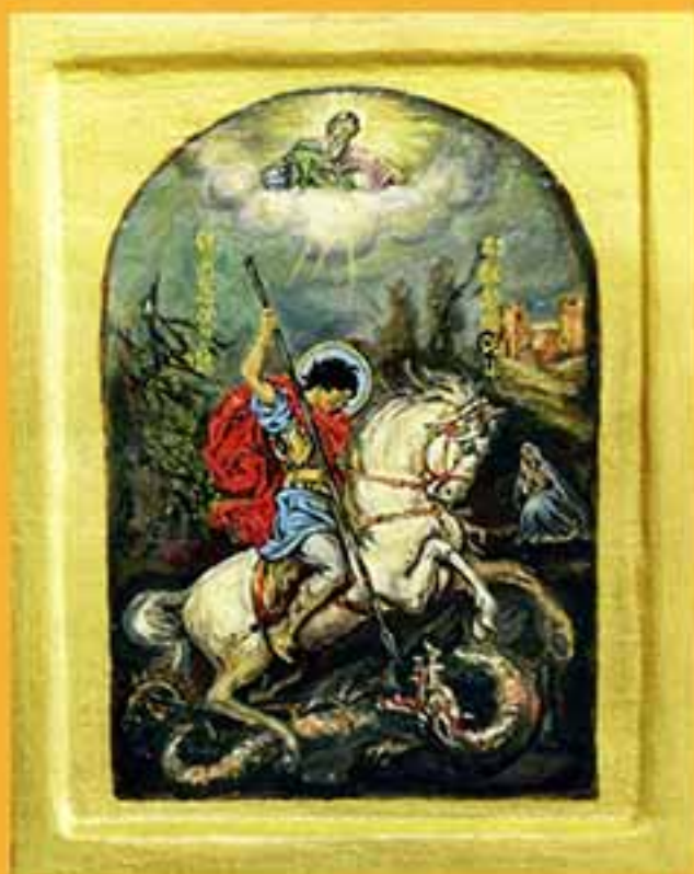
Икона «Св. Муч. Георгий Победоносец», 2002 г., 37,5х29,5, доска, темпера.