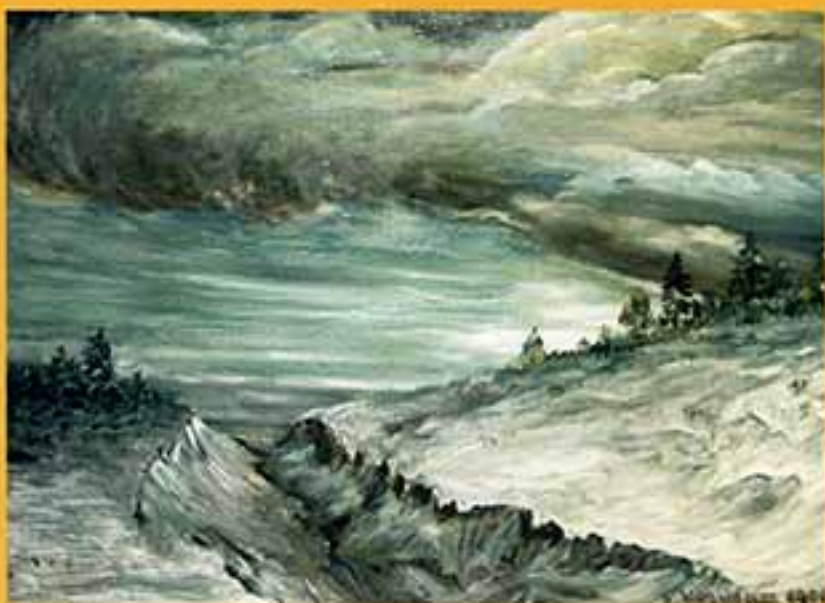
Стужа, 1998 г., 40x52, холст, масло.