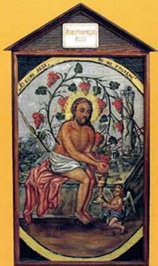
Икона «Жизнотворная лоза», 2002 г., 59x37, доска, масло.